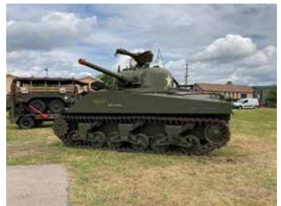
CHAR SHERMAN américain