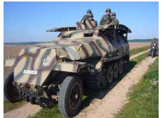
SDKFZ 251 allemand