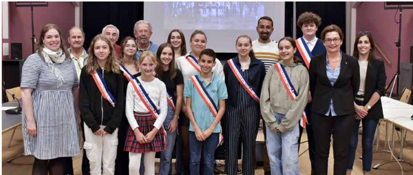
Dernière réunion plénière des C.M.E et C.M.J. élus en 2021

Après un mandat riche en initiatives, les élus des Conseils Municipaux des Jeunes et des Enfants ont passé le flambeau du renouvellement démocratique. Leur engagement a été marqué par une série de projets visant à embellir notre ville et à répondre aux besoins de la jeunesse.