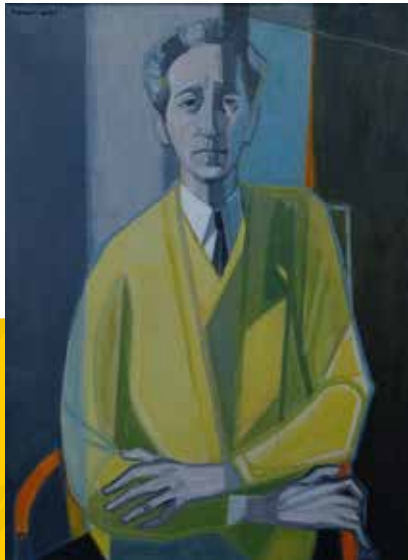
© Jean Cocteau en 1958 par François FRET