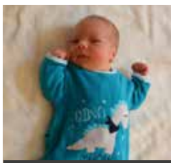
Paul VALLENDORFF né le 05 août 2021