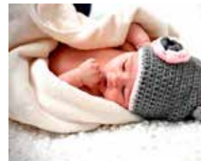
Victoria DAMIENS le 17 février 2021